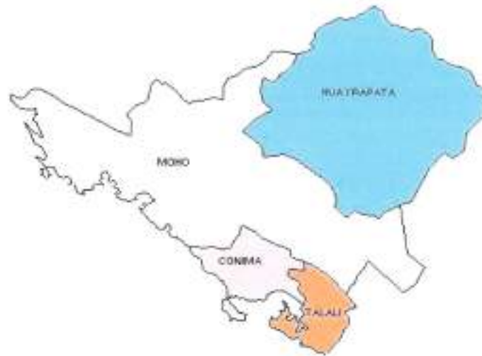
GRAFICO 1 Vista panorámica de la UGEL Moho en Mapa Escale

La UGEL – Moho de ubicación geográfica en el contexto nacional, departamental y provincial